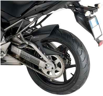
KMG4103 Parafango specifico in ABS, colore nero