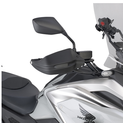
KHP1192B Paramani specifico in tecnopolimero, nero