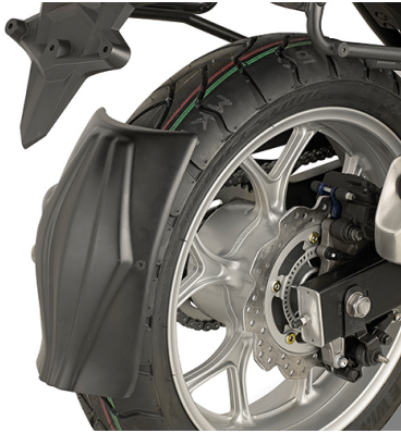
RM1146KITK Spezifisches Montagekit für Universal Hinterradabdeckung KRM01, KRM02