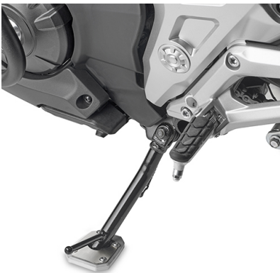
ES1192K Spezifische Fuß-Verbreiterung aus Aluminium und Edelstahl, um die Standfläche des originalen Seitenständers zu erweitern.