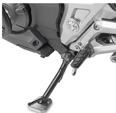
ES1192K Spezifische Fuß-Verbreiterung aus Aluminium und Edelstahl, um die Standfläche des originalen Seitenständers zu erweitern.